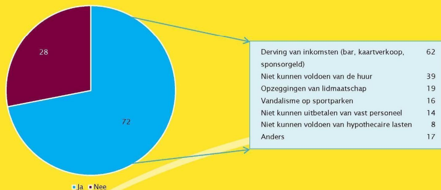
Figuur 3 Percentage gemeenten waar verenigingen zich eind maart/begin april hebben gemeld met problemen en uitsplitsing van de aard van de problemen van verenigingen (in procenten van gemeenten; n=156)