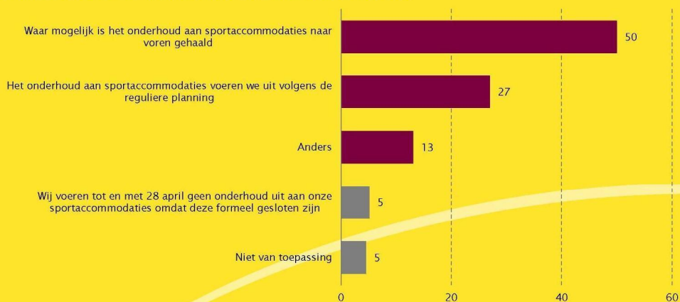
Figuur 2 Welke lijn wordt eind maart/begin april binnen uw gemeente of gemeentelijk sportbedrijf gevolgd als het gaat om onderhoud van sportaccommodaties? (in procenten van gemeenten; n=156)

Bron: Mulier Instituut/VSG: Coronapeiling VSG-panel, april 2020.